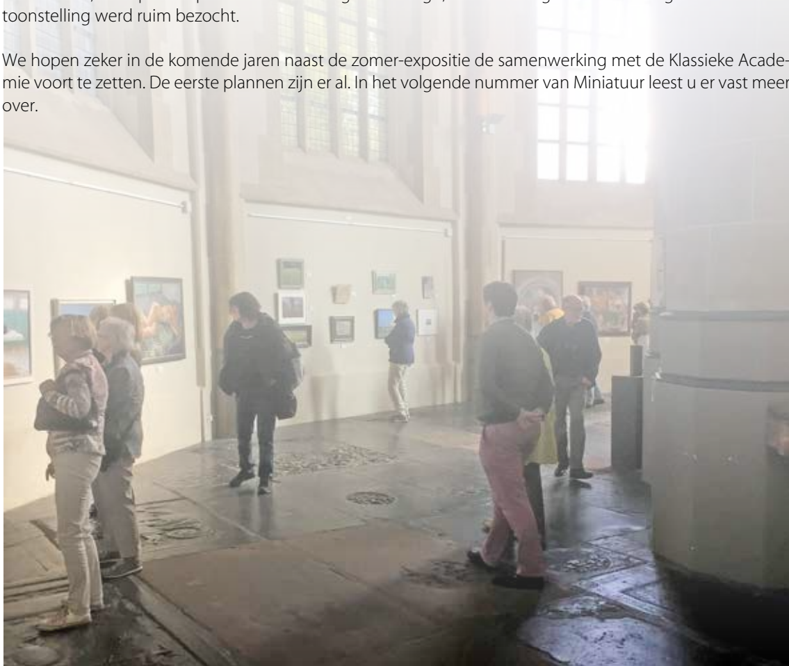
Bezoekers bij "Hommage aan Matthijs Röling"

We hopen zeker in de komende jaren naast de zomer-expositie de samenwerking met de Klassieke Academie voort te zetten. De eerste plannen zijn er al. In het volgende nummer van Miniatuur leest u er vast meer over.