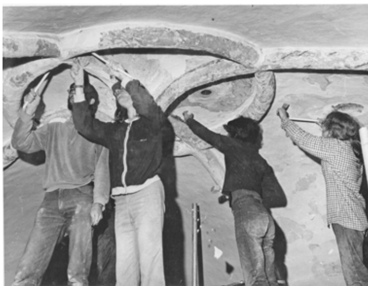
De gewelfschilderingen komen stukje bij beetje tevoorschijn.