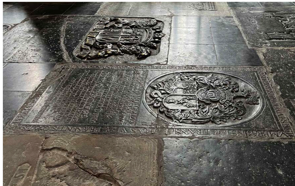
◀ Grafplaten in het koor van de Martinikerk.