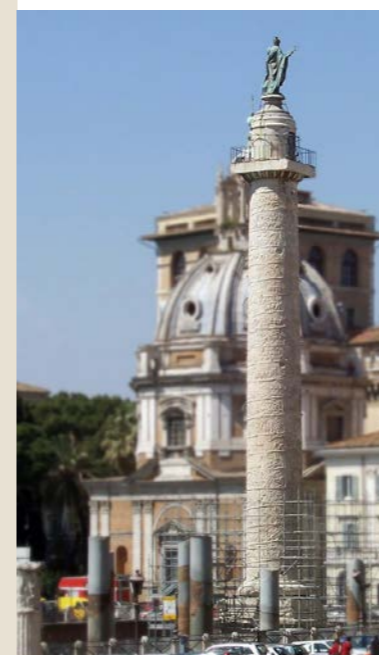
◀ Zuil opgericht in 113 n.Chr. als bewaarplaats voor de as van keizer Trajanus, later vereerd als monument voor al zijn heldendaden, onder andere de verovering van Dacië (het huidige Roemenië). Het onderschrift op de sokkel luidt: 'Deze zuil is even hoog als de heuvel die ervoor werd afgegraven.'

In 563 verbood het Eerste Concilie van Braga het begraven in de kerk. Deze stellingname werd bij volgende concilies herhaaldelijk bevestigd, zij het met de volgende uitzondering: alleen