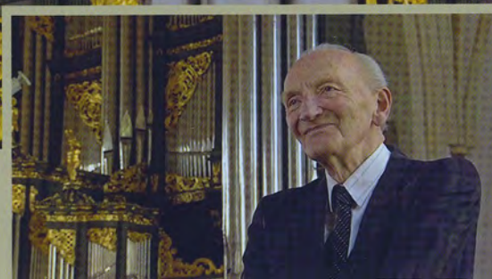
Het orgel en zijn adviseur